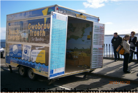
Plava Zastavica Crna Gora - 20.10.2012. GODIŠNJI SKUP MEĐUNARODNIH KOORDINATORA PLAVE ZAS