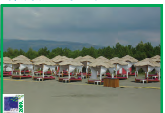
23. MCM BEACH - VELIKA PLAŽA