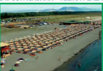
24. COPACABANA - VELIKA PLAŽA