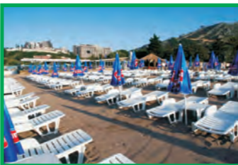
10. DOLCE VITA - BEČIČI