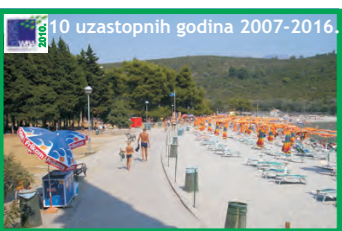
4. PLAVI HORIZONTI - RADOVIĆI