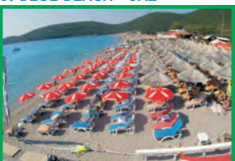
6. BLUE BEACH - JAZ