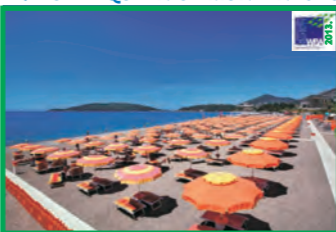
12. HOTEL QUEEN OF MONTENEGRO