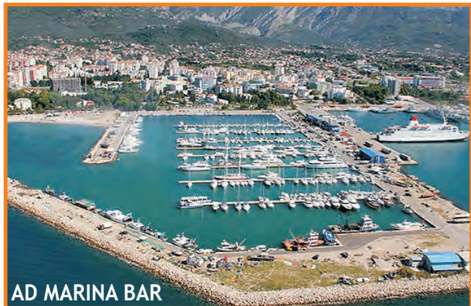
AD MARINA BAR