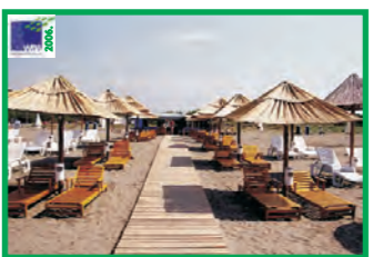
19. MIAMI BEACH - VELIKA PLAŽA