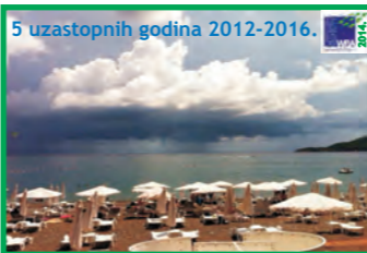
11. SVETI TOMA - BEČIČI