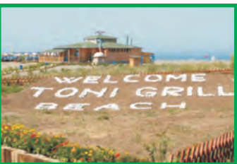
18. TONI GRILL - VELIKA PLAŽA