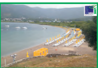
4. KALARDOVO - TIVAT