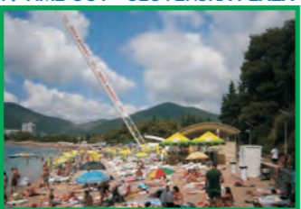
9. TIME OUT - SLOVENSKA PLAŽA