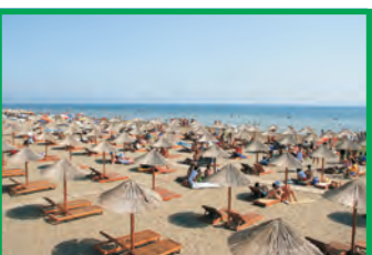
22. EVROPA BEACH - VELIKA PLAŽA