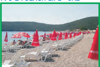
7. S & I BEACH LIFE - JAZ