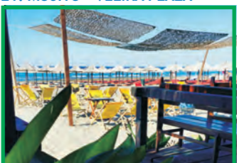
21. MOJITO - VELIKA PLAŽA