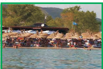
5. ESCALERRA BEACH - JAZ