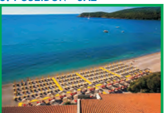
8. POSEIDON - JAZ