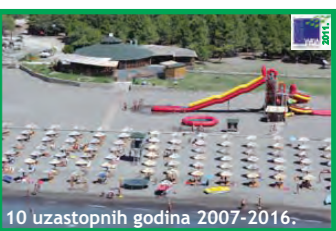
20. SAFARI BEACH - VELIKA PLAŽA