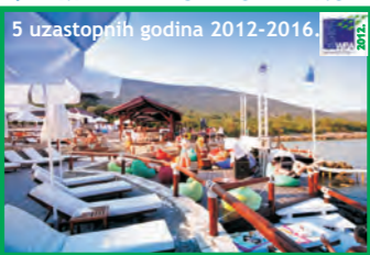
2. ALMARA BEACH - OBLATNO