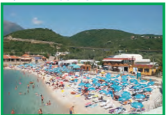
17. PARADISO - UTJEHA