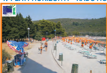
4. PLAVI HORIZONTI - RADOVIĆI