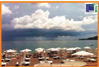
12. SVETI TOMA - BEČIĆI