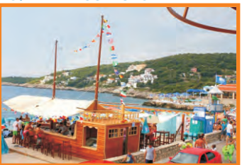
18. PARADISO - UTJEHA