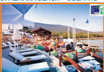
3. ALMARA BEACH - OBLATNO