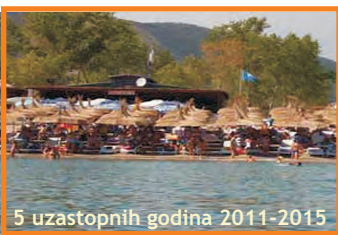
7. ESCALLERA BEACH - JAZ