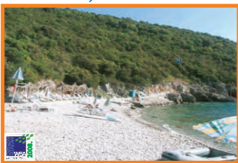
2. STEVUZO, DOBREČ - LUŠTICA