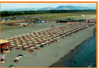
24. COPACABANA - VELIKA PLAŽA