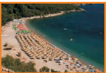
14. KAMENOV BEACH - KAMENOVO