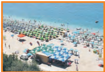
15. LA SUERTE - KAMENOVO