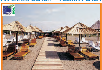
19. MIAMI BEACH - VELIKA PLAŽA