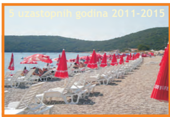
8. S & I BEACH LIFE - JAZ