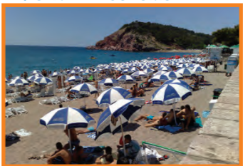
17. CENTAR - SUTOMORE