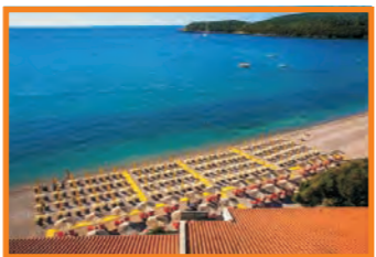
9. POSEIDON - JAZ