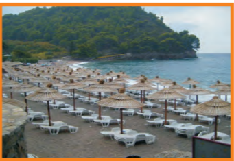
16. LUČICE - LUČICE