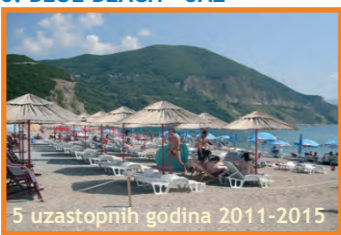
6. BLUE BEACH - JAZ