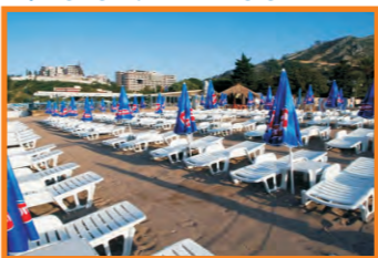
11. DOLCE VITA - BEČIĆI