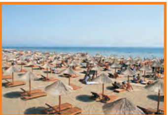
22. EVROPA BEACH - VELIKA PLAŽA