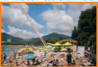
10. TIME OUT - SLOVENSKA PLAŽA