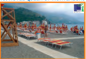
13. HOTEL QUEEN OF MONTENEGRO