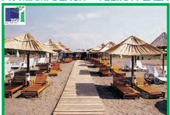
14. MIAMI BEACH - VELIKA PLAŽA