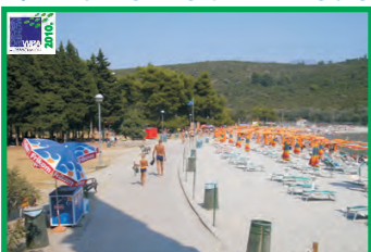
4. PLAVI HORIZONTI - RADOVIĆI