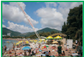
9. TIME OUT - SLOVENSKA PLAŽA