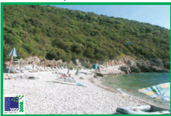
2. STEVUZO, DOBREČ - LUŠTICA