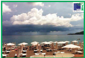
10. SVETI TOMA - BEČIĆI