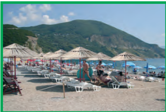
6. BLUE BEACH - JAZ