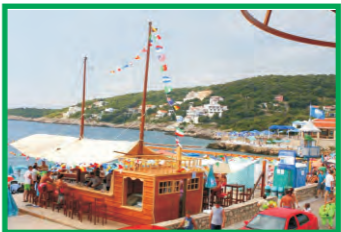
12. PARADISO - UTJEHA