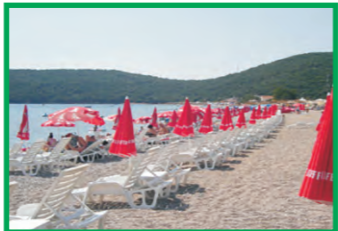
8. S & I BEACH LIFE - JAZ