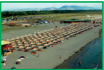
18. COPACABANA - VELIKA PLAŽA