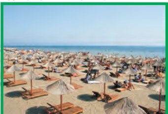
15. EVROPA BEACH - VELIKA PLAŽA