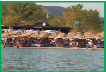
7. ESCALERRA BEACH - JAZ