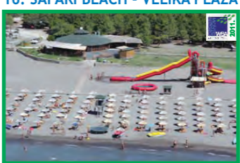
16. SAFARI BEACH - VELIKA PLAŽA