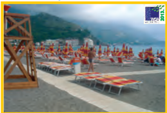
11. HOTEL QUEEN OF MONTENEGRO