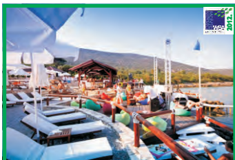
3. ALMARA BEACH - OBLATNO

Originalno francuska ideja iz 1985. godine, Plava zastavica je nakon tri decenije postala ekskluzivno eko-obilježje u 49 zemalja. Tokom ljeta 2015. godine biće dodjeljena za preko 4.000 plaža i marina u zemaljama sjeverne hemisfere (Evropa, Maroko, Tunis, Jordan, Izrael, Ujedinjeni Arapski Emirati i Kanada). Od tog ukupnog broja, 18 plavih zastavica vijoriće se na lupalištima Crnogorskog primorja, a još 12 plaža i 1 marina se nalaze u pilot programu 2015.