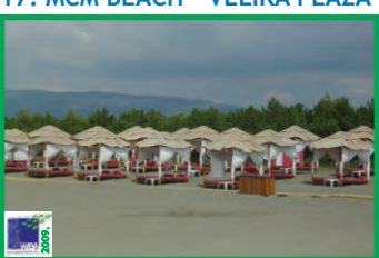
17. MCM BEACH - VELIKA PLAŽA